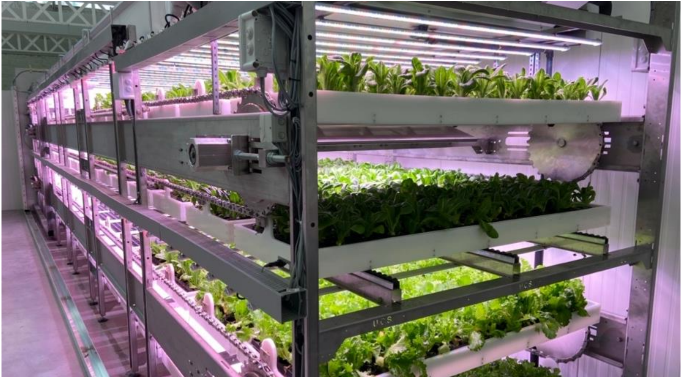
Model X.

Urban Crop Solutions est une entreprise belge fondée en 2014. Elle a vendu des conteneurs de par le monde et notamment en Belgique, en Amérique du Nord, en Scandinavie, à Singapour et autres pays d'Asie du Sud Est. En 2020, l'entreprise comptait 35 clients, dont certains possèdent plusieurs conteneurs. Environ 35% des clients sont des instituts de recherche tels que l'université de Liège ou de Louvain. Urban Crop Solutions conduit des projets de recherches depuis sa création et a ouvert en 2018 un centre de recherche à Waregem, près de Ghent. Dans ce centre, un tiers des projets de recherche sont effectués par l'entreprise pour développer des recettes de culture qui seront partagées avec ses clients, un tiers de la recherche est subventionnée par le gouvernement belge et le dernier tiers est conduit par des clients de l'entreprise pour le développement leurs propres recettes de cultures.