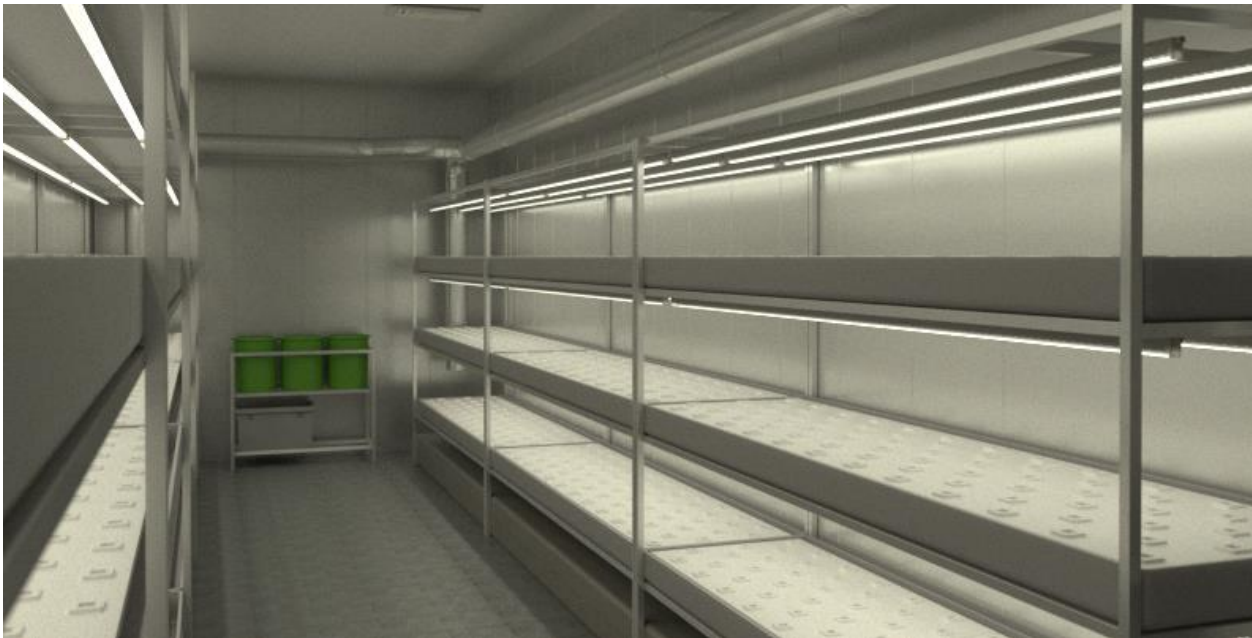
Vue schématique du conteneur Growcer

Growcer est une entreprise installée à Ottawa depuis 2015. L'entreprise développe et vend des conteneurs aménagés pour la production agricole, et en particulier à des clients situés dans des territoires reculés, où les produits frais sont difficiles d'accès ou peu abordables.