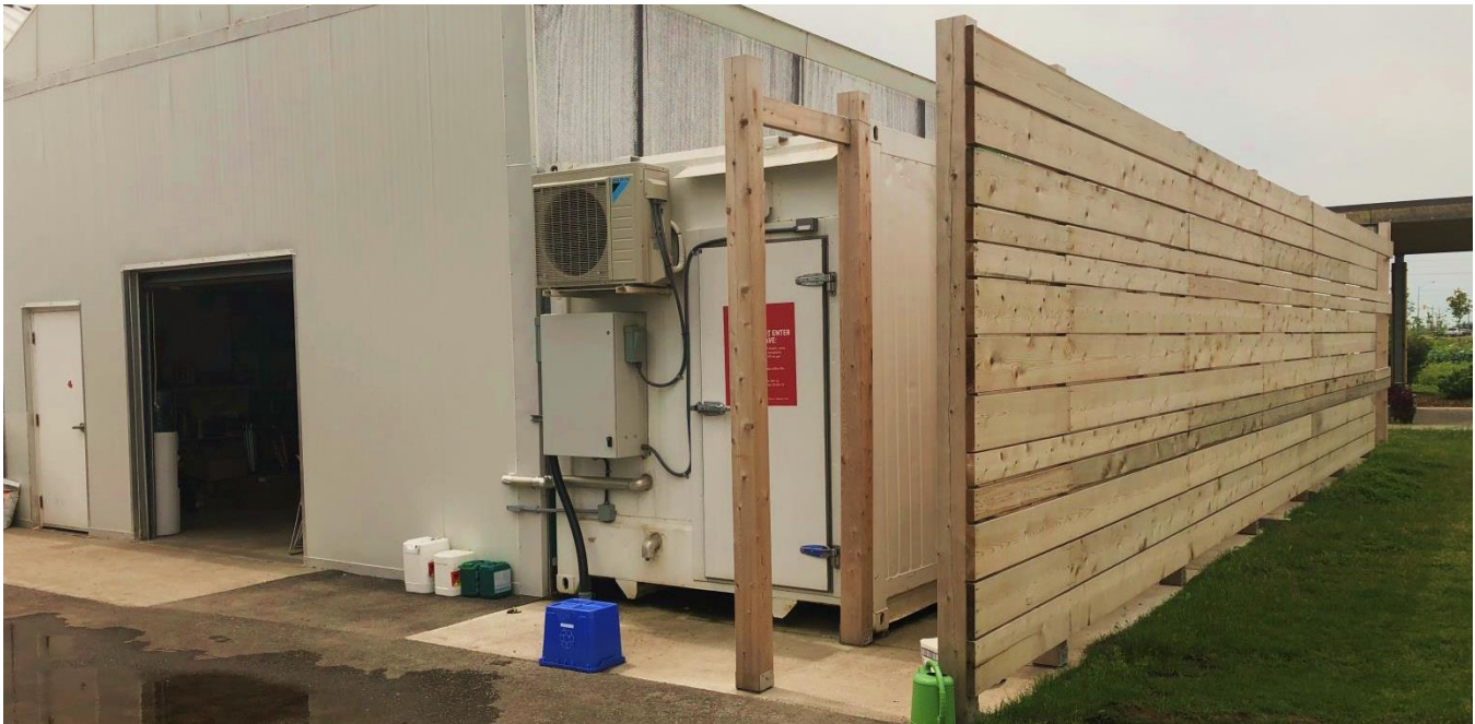
Conteneur de la marque Freight Farms, opéré par Durham College en Ontario, Crédit photo : Ryan Cullen (Durham College).

Freight Farms est l'un des premiers fabricants de conteneurs étant apparus sur le marché. L'entreprise de Boston a débuté en 2011 à la suite d'une levée de fond communautaire sur le site Kickstarter pour développer leur premier prototype. Entre 2013 et 2015, Freight Farms a vendu 118 conteneurs du modèle Leafy Green Machine . 7 Une seconde génération de conteneurs, The Greenery , a été développée en 2019 et son dernier modèle, Greenery S est entré sur le marché en 2021. À date, Freight Farms rapporte avoir vendu 350 conteneurs dans 33 pays et 5 continents. 8 Il y a 2 entreprises opérant un conteneur de la marque dans un bâtiment commercial au Canada, dont une en fonctionnement à Durham College en Ontario.