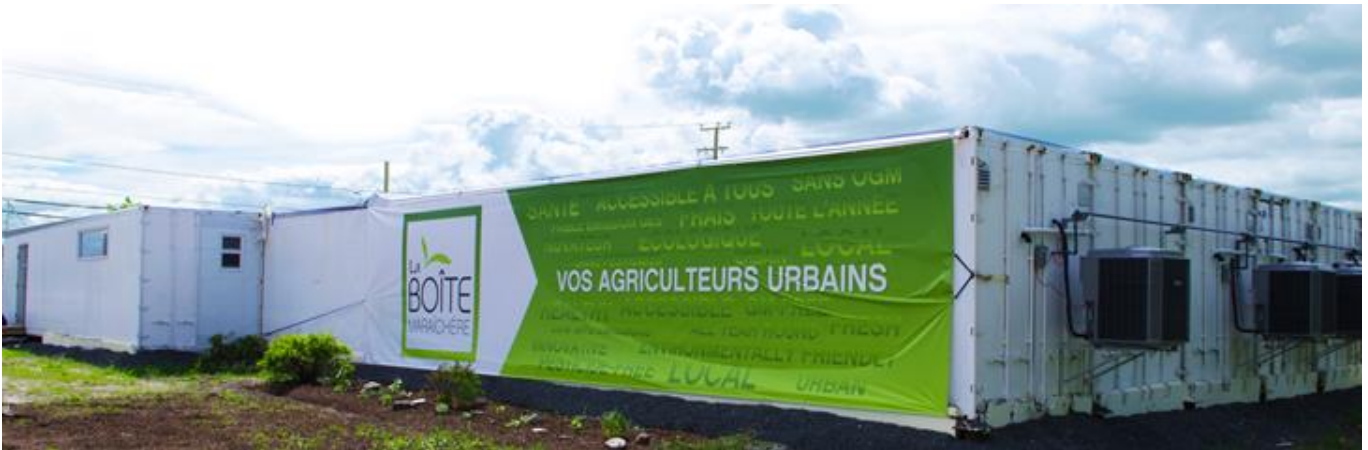
Complexe de 10 conteneurs La Boîte Maraîchère à Laval, Québec.

La Boîte Maraîchère est une entreprise québécoise fondée en 2016 et installée dans le parc agricole de Laval depuis 2017. Elle y a développé un complexe de 10 conteneurs aménagés pour la production agricole. Ce premier complexe a d'abord été utilisé comme site de démonstration et de recherche. Il est présentement en mise à niveau afin d'être consacré entièrement à la production commerciale. Le volet de recherche et développement sera déménagé sur un autre site. L'entreprise a obtenu le premier prix dans la catégorie Bioalimentaire du volet création d'entreprise au Défi OSEntreprendre Laval.